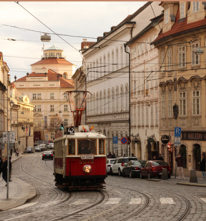
De lokale tram van Praag