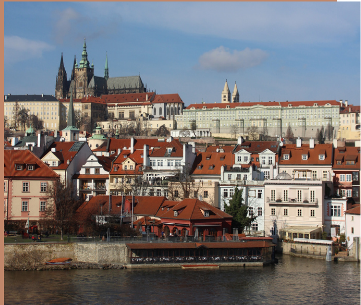
Uitzicht op de Burch vanaf de Karelsbrug

Hiervoor loop je (in de meeste gevallen) terminal 1 of 2 uit en stap je in bus 59 of 414 richting Nádraží Veleslavín. Vervolgens stap je uit bij de halte Nádraží Veleslavín van de bus. Hier kun je overstappen op de metrolijn A richting Nemocnice Motol. Afhankelijk van je exacte bestemming kun je in het centrum van Praag uitstappen. In de meeste gevallen zal dit bij metrostation Můstek zijn.