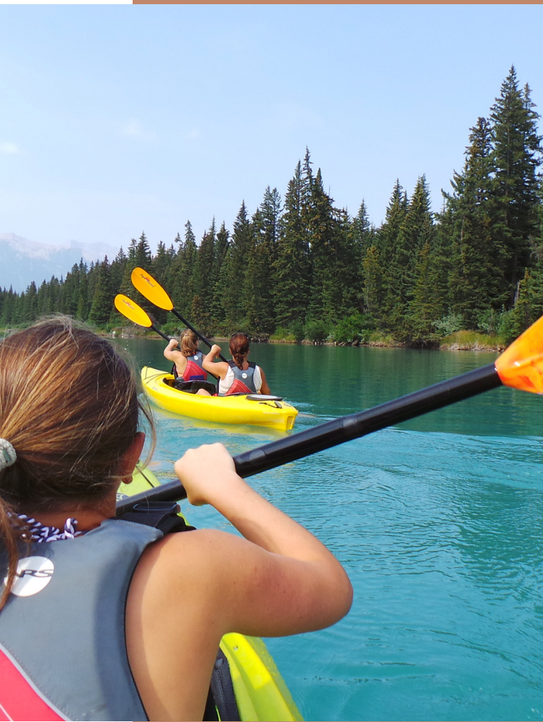
Kajakken over de Bow River, Banff

Dinertip: Als je het mij vraagt is Mexicaans eten altijd een goed idee! Ook Banff beschikt over een heerlijk en gezellig Mexicaans restaurant, genaamd Magpie and Stump.