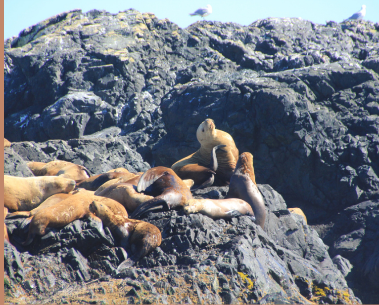
Tofino, Vancouver Island

Vanuit Nanaimo is het weer een prachtige boottocht richting Vancouver. Vanuit Vancouver staat er nog een prachtige rit richting Whistler te wachten. Vanuit Whistler kun je prachtige wandelingen maken en van de ene naar de andere top met de 'Peak2Peak' gondel. De plaats Whistler zelf is ook erg leuk om doorheen te lopen. Er zijn veel winkels en veel gelegenheden om lekker op een terrasje te zitten, een drankje te doen en lekker uit eten te gaan.