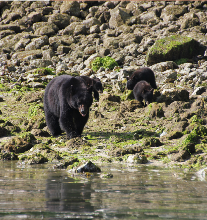
Tofino, Vancouver Island