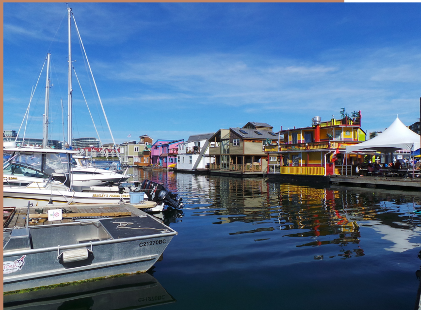
Victoria, Vancouver Island

De reis begint in de bruisende stad Vancouver. Vancouver is een redelijk grote stad en leent zich dan ook perfect voor het gebruiken van een fiets. Met de fiets kom je nou eenmaal verder en kun je meer zien. Fiets bijvoorbeeld door Stanley Park, waar een prachtige fietsroute langs het water is aangelegd! Leuke wijken om door heen te fietsen, zijn Gastown en ook zeker China Town is een bezoekje waard. Wat je ook zeker niet mag missen tijdens jouw bezoek aan Vancouver is Granville Island, wat te bereiken is te voet (over de brug) of met de zogeheten 'Aquabus'.