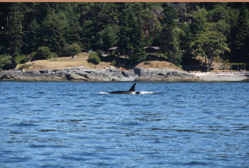
Victoria, Vancouver Island

Nadat je hebt kunnen genieten van het bruisende Vancouver, stap je op de ferry richting Vancouver Island waarbij je eerste stop in de plaats Victoria zal zijn. Victoria is een gezellig knusse stad, waarin en waar vandaan je diverse uitstapjes kunt doen. Breng bijvoorbeeld een bezoek aan Fisherman's Wharf, waar de kleurrijke huisjes je tegemoet komen. Vanuit Victoria is het tevens mogelijk om diverse boot tours te doen. Zo kun je hier een Orca watching tour doen via Orca Spirit Adventures . Absoluut een aanrader! Wij hebben zelfs het geluk gehad een baby orca te zien. Met gepaste afstand zal de boot vaart minderen om goed zicht te hebben op de Orca's, terwijl je hierdoor niet de leefbaarheid van de Orca's verstoort. Onderweg heb je ook de kans om zehonden en zeeotters te zien en krijg je meer informatie over de omgeving en het wildlife.