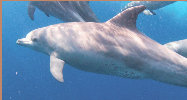
Wilde dolfijnen op Zanzibar