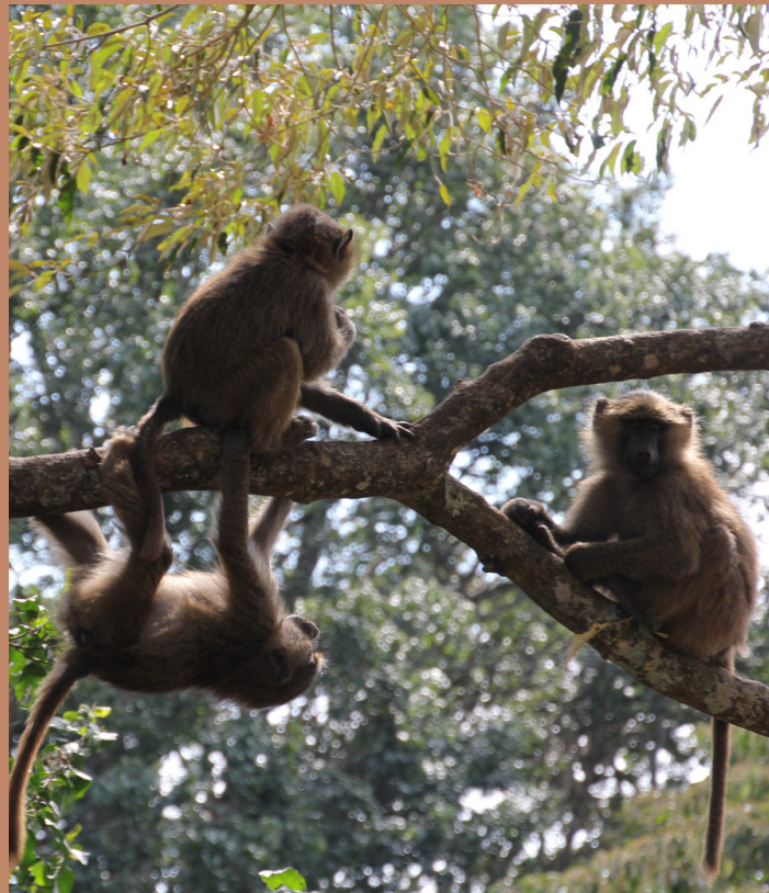
Lake Manyara National Park