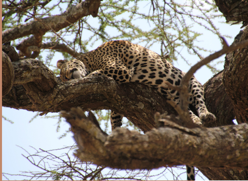
Serengeti National Park

Wanneer je vanuit Amsterdam op Arusha vliegt zul je in de meeste gevallen je reis beginnen in het Tarangire National Park. Een prachtig park dat bekend staat om de grote groepen olifanten die hier leven. Daarnaast staat het park bekend om de vele jarenoude Baobab bomen die hier groeien. Natuurlijk vindt je hier ook diverse andere wilde dieren, zoals zebra's, leeuwen, giraffen en gnoes. In dit park kun je niet alleen overdag een game drive doen, maar kan dat ook 's nachts. Daarnaast is het mogelijk om het park vanuit een luchtballon te bewonderen, of bijvoorbeeld ter voet de natuur in te gaan.