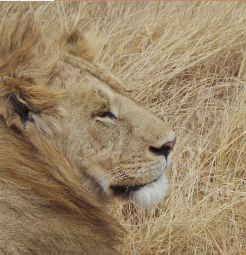
Ngorongoro National Park