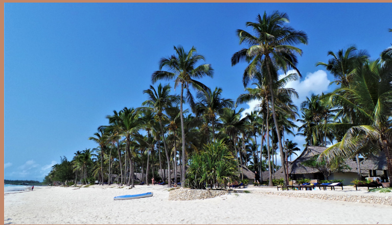
Strand van Zanzibar