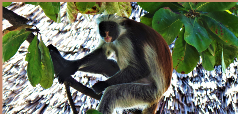
De rode franjeaap