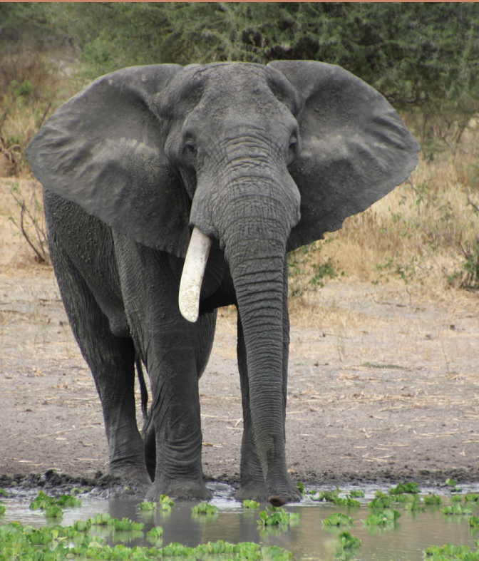
Tarangire National Park